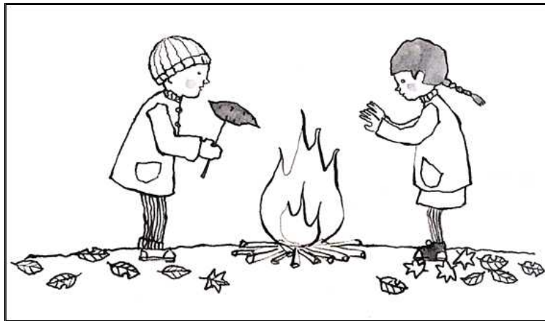
【図1】 初回に鑑賞した「たき火」の絵(三森2002:76)

教師はさらに、学生Aが左側の人物を「男の人」と述べたことについて根拠を示すように求めている。学生Aは、右側の人物は「髪の毛が長」く、「スカートはいている」として、絵のなかの2人の人物の服装や髪型に注目し、その違いから男女の別を判断したと述べている(発言10)。この発言を受けて、絵のなかの人物について注目が集まり、この二人の人物の関係についてさまざまな意見が出されることになる。