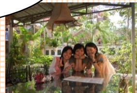
ベトナムにはたくさんカフェがあります。決まったカフェにしか行かないので、色々なカフェを開拓中です。