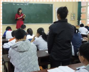
「にほんご8」を使って授業

私は、ハノイ市内にある、Thuc Nghiem 中学校、Ly Thung Kiet 中学校、Trung Vuong 中学校、Lomonoxop 中学校(2週に1回)、Le Quy Don 中学校(1カ月に1回)で、週12コマ(1コマ45分)の日本語授業をカウンターパートであるベトナム人教師3名(以下:CP:A,CP:B,CP:C)と共に、チームティーチング(以下:TT)で授業を行っていました。教科書は、ベトナムの教育訓練省が規定した教科書『にほんご』を使用しています。