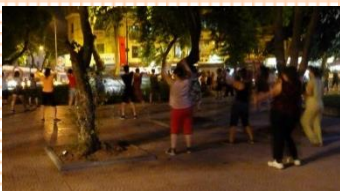
ハノイの路上エアロビ!!

日本ではチャイムが授業の終わりを知らせてくれる合図ですが、ベトナムの中等学校では、警備員が鳴らす太鼓が授業の終わりの合図です。タイコのリズムも決まっているようです。初めて聞いた時は驚きました。