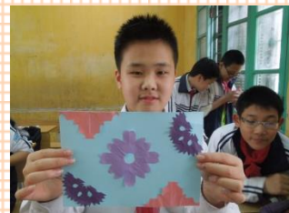
折り紙で「こいのぼり」上手に切り紙できたかな? を作りました。