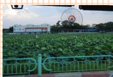
蓮の花ツアー 隣はベトナム語の先生

「ベトナム料理ベスト3」 「私のベトナムでの楽しみ」 「残りの任期で体験してみたいこと」 「ベトナムのあれこれ」もあります！