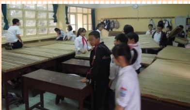
机の上にゴザを敷いてみんな一緒にお昼寝をします。